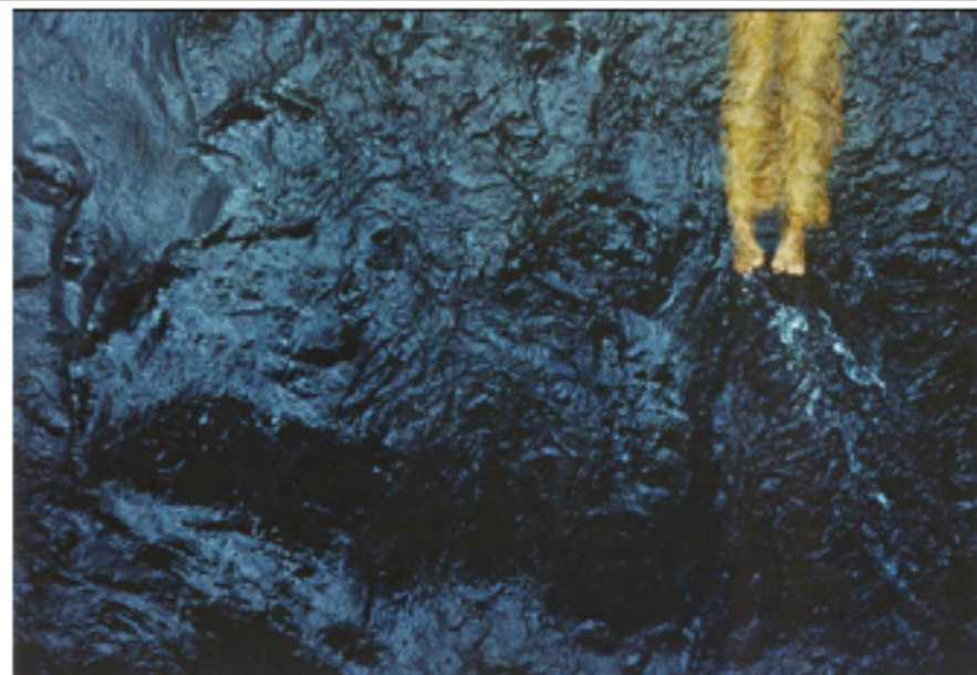
Renata Siqueira Bueno Air Liquide #2, 2001 Tirage argentique édition 3/5 + 1EA 120 x 180 cm