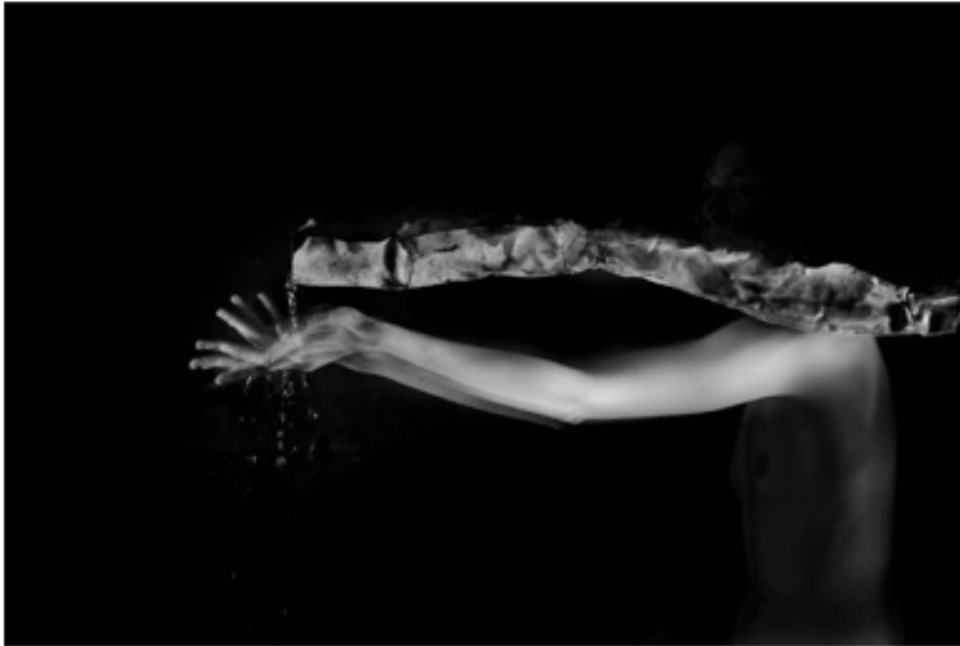
Antoine Rozès 09 - Rituels Lamelliformes, 2012 Impression numérique pigmentaire réalisée par Franck Bordas Sur papier Canson Signé, daté, numéroté par l'artiste