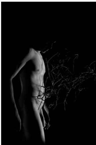
Antoine Rozès Rituels Lamelliformes - "Tendre amour, a tes peines que tu mêles de douceur à mon coeur" Orphée Euridyce, 2012 Impression numérique pigmentaire sur papier Rag photographique Canson 310g Studio Franck Bordas Signé, daté, numéroté par l'artiste Ed 1/5 60 x 90 cm