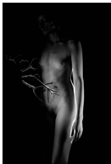
Antoine Rozès Rituels Lamelliformes - "Tendre amour, que tes chaînes ont de charmes pour mon coeur" Orphée Euridyce, 2012 Impression numérique pigmentaire sur papier Rag photographique Canson 310g Studio Franck Bordas Signé, daté, numéroté par l'artiste Ed 1/5 60 x 90 cm