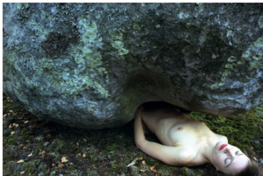
Philippine Schaeffer Sous la pierre, 2005 Tirage Argentique Diamantino Quintas Ed 1/5 80 x 120 cm

Photographies de Renata Siqueira Bueno, Philippine Schäfer, Antoine Rozès Exposition du 28 mars au 30 avril 2013 Anoa Galerie 6, rue Bonaparte Paris 75006 France Tel 0611134153 contact@anoa-galerie.com